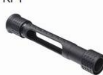
Through Base Bottom