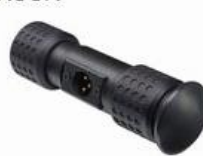
XLR Right Angle Out