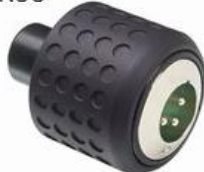
XLR Bottom Module